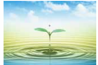
三昌エコロジー株式会社

エコフィードで食品リサイクル 食パンの製造副産物やカット屑、在庫調整品などを原料として、乾燥粉末タイプのエコフィードを製造。エコフィードは配合飼料メーカーに販売され、良質な配合飼料原料として利用されています。