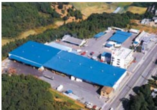
三昌運輸倉庫株式会社

暮らしに届く物流システムを確保 安全・正確・丁寧な需要と供給の橋渡しをモットーに…三昌物産の各種商品のみならず、暮らしに届く物流の拠点として地域産業に貢献しています。全国規模の運輸業務一切を行いながら、生産と消費を結ぶパイプ役として機能しています。