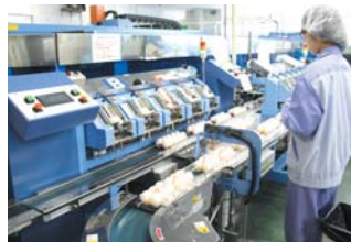
三昌鶏卵株式会社

暮らしに届く物流システムを確保 安全・正確・丁寧な需要と供給の橋渡しをモットーに…三昌物産の各種商品のみならず、暮らしに届く物流の拠点として地域産業に貢献しています。全国規模の運輸業務一切を行いながら、生産と消費を結ぶパイプ役として機能しています。