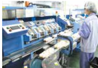
三昌鶏卵株式会社

暮らしに届く物流システムを確保 安全・正確・丁寧な需要と供給の橋渡しをモットーに…三昌物産の各種商品のみならず、暮らしに届く物流の拠点として地域産業に貢献しています。全国規模の運輸業務一切を行いながら、生産と消費を結ぶパイプ役として機能しています。