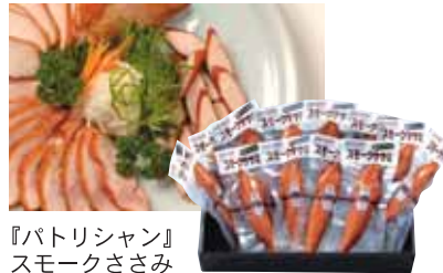
『パトリシャン』 スモークささみ