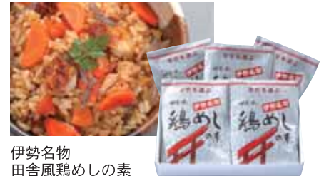
伊勢名物 田舎風鶏めしの素