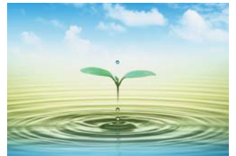
三昌エコロジー株式会社

エコフィードで食品リサイクル 食パンの製造副産物やカット屑、在庫調整品などを原料として、乾燥粉末タイプのエコフィードを製造。エコフィードは配合飼料メーカーに販売され、良質な配合飼料原料として利用されています。