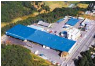
三昌運輸倉庫株式会社

暮らしに届く物流システムを確保 安全・正確・丁寧な需要と供給の橋渡しをモットーに…三昌物産の各種商品のみならず、暮らしに届く物流の拠点として地域産業に貢献しています。全国規模の運輸業務一切を行いながら、生産と消費を結ぶパイプ役として機能しています。